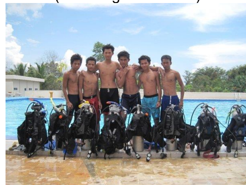
Foto Kegiatan Sertifikasi Selam ( one star ) Pengurus PDC Priode 2009-2010 di Loka Tirta Sungailiat