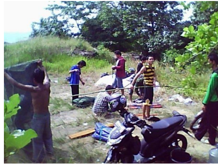
Foto persiapan Pengukuhan Pengurus Priode 2009-2010 di Pantai Teluk Limau (sekarang turun Aban)