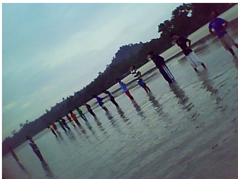
Foto Kegiatan pengukuhan Pengurus Periode 2009-2010 di Pantai Matras