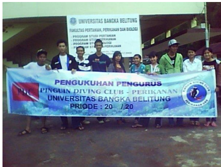
Foto Didepan Kampus FPPB Sungailiat Pengukuhan Pengurus Priode 2009-2010

Kerjasama dengan Pinguin Diving Club melibatkan bapak/ibu dosen, mahasiswa/i internal Jurusan Perikanan, serta eksternal Jurusan Perikanan. Selain itu, kerjasama juga terjalin dengan dinas-dinas terkait, seperti Dinas Perikanan dan Kelautan baik Tingkat Kabupaten, Provinsi maupun Tingkat Kementerian, Perusahaan BUMN maupun Perusahaan Swasta. Sebenarnya bukan tanpa alasan mengapa mitra bekerjasama dengan Pinguin Diving Club, hal ini dikarenakan Anggota Pinguin Diving Club memiliki soft skill atau kompetensi dibidangnya diantara seperti basic scientific diver dan memiliki sertifikasi minimal one star . Dana dari hasil Kerjasama itulah dimanfaatkan untuk pengembangan personal pengurus dan anggota maupun organisasi Pinguin Diving Club sampai dengan masa priode 2009 – 2010.